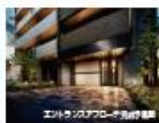
Esリード 住吉大社前レジデンス