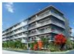
プレディア京都桂御所