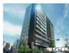
Esリード 八尾駅前ザ・レジデンス