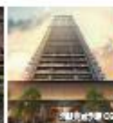
ザ・パークハウス 大阪上本町タワー

住居情報(オンライン)の更新 までに三菱地所レジデンス 専用サイトから「紹介カード」の 発行がない場合は、 提携割引期間(0.5%)の 適用対象外となりますので ご注意ください。