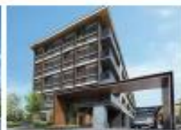
ハイムスイート京都太秦天神川