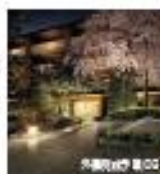
ザ・パークハウス 京都聖徳院