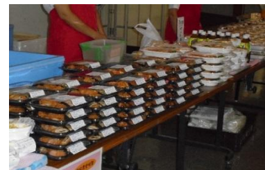
テイクアウト弁当