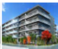
プレディア京都 桂御所