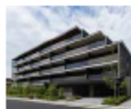
京都円町 GRAND PLACE