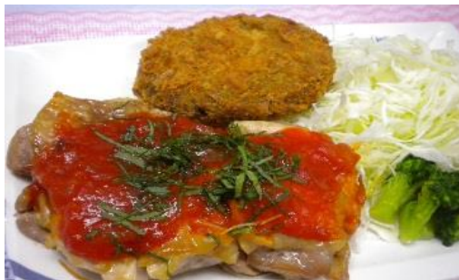
チキン大葉トマト