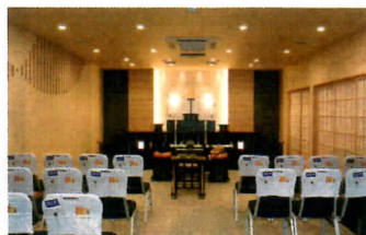
写真はホール内の一例です。